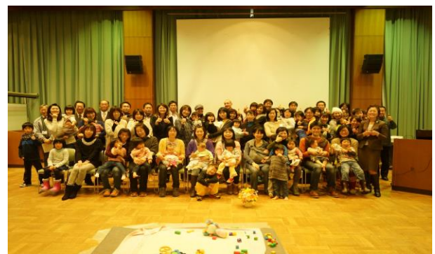
第2回 お母さんがまちを創る