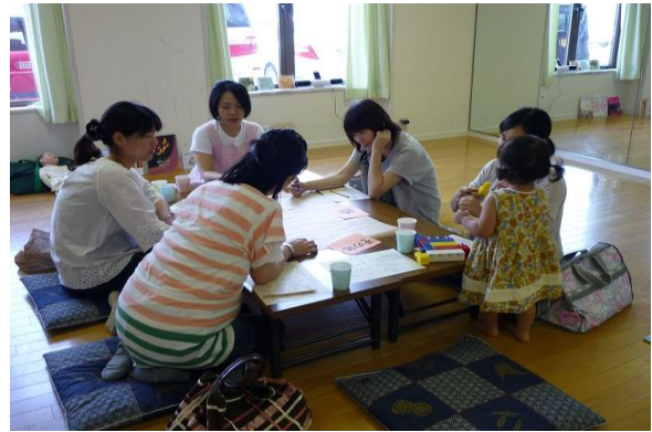
マタニティー(十月十日)の楽しみ方